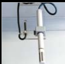
Sondas de temperatura y humedad relativa

Nota: las cámaras se entregan de serie sin suelo