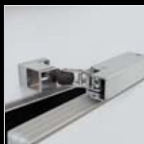
Cierre con empuje automático