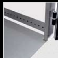
Conducto de distribución del aire integrado